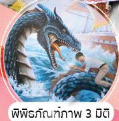
พิพิธภัณฑ์ภาพ 3 มิติ

เริ่มต้น นำท่านเห็นฟ้าสู่ท่าอากาศยานนานาชาติอินชอน สวนสนุกลือตเต้เวิลด์...สวนสนุกที่ใหญ่ที่สุดของประเทศ ฮานิลปาร์ค... มหาวิทยาลัยสตรีจ็องวอน โบสถ์เมียงดง พิพิธภัณฑ์ภาพ 3 มิติ พิพิธภัณฑ์น้ำแข็ง โซลกาเวออร์ หมู่บ้านนุกซอนฮันอก พระราชวังชางด็อกกุง สวมชุดฮันบก... ชุดประจำชาติเกาหลี พร้อมถ่ายรูปเป็นที่ระลึก ซอปปิง ย่านองแด และ เมียงดง เมบูพิชเชซ !!!...ซึ่งยังมีคิวนูฟเฟต์ มีน้ำดื่มบริการบนรถบัสส่วนตัว 1 ขวด